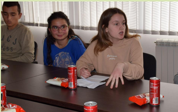
Посета представника Ђачког парламента председнику Општине Пећинци