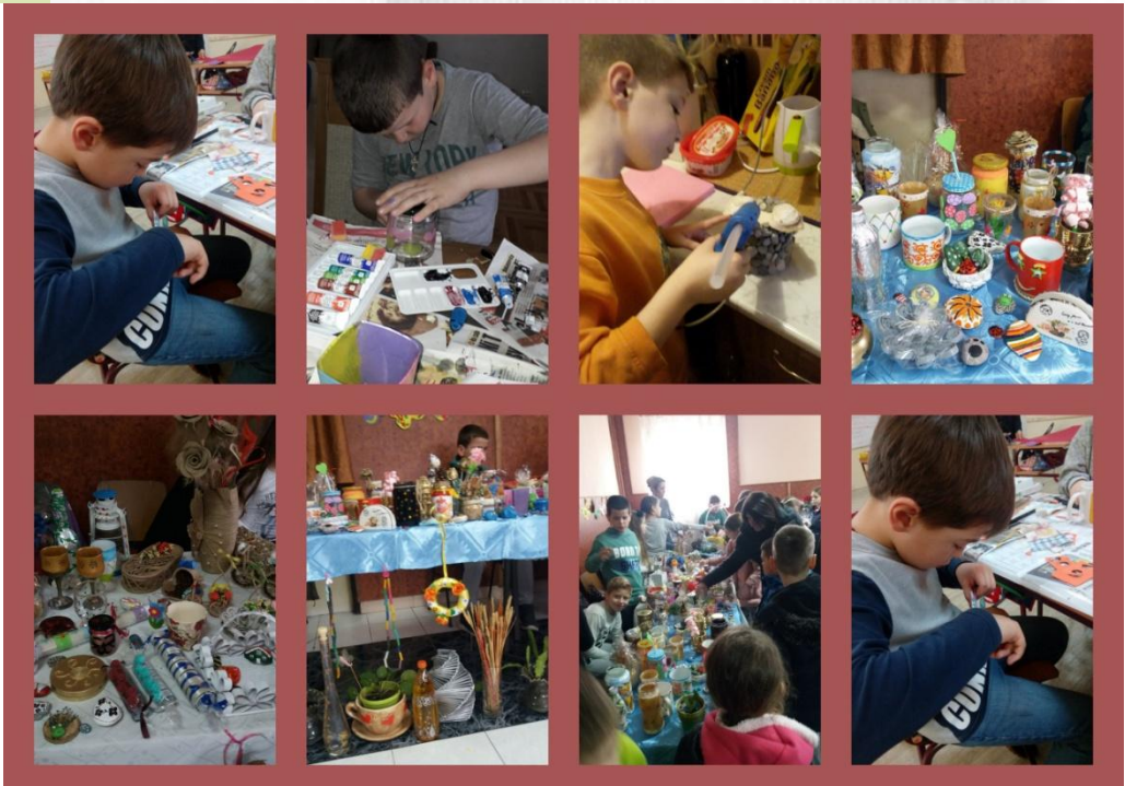
Припреме за базар...